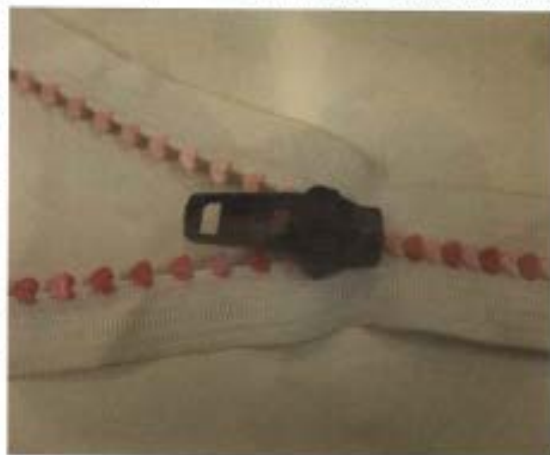
Zip à dents en forme de cœur chez Paskal.

à y suspendre une caméra, sans se scier la nuque. Le même fabricant propose également une boucle rotative, qui épouse mieux le mouvement, utile pour l'escalade par exemple. Du nouveau encore dans les sangles